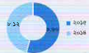
শেয়ার প্রতি আয়